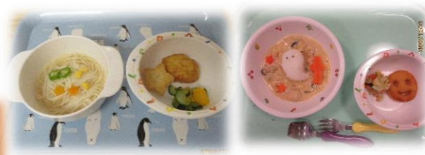
☆七夕行事食☆ そうめん お星さまポテト・野菜

かすみ園では行事食や手作りおやつなどいつもは違う献立、メニューを作って提供しています。