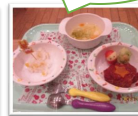
クリスマス行事食