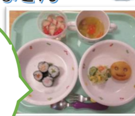
ひなまつり行事食