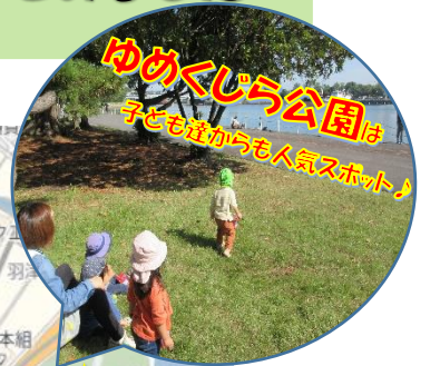
ゆめくじら公園は 子ども達からも人気スポット♪

移動手段として手繋ぎ歩き or 大型ベビーカーを利用しています この大型ベビーカーもただ乗っているだけじゃないんだよ〜 でこぼ道や坂道を通過する際、自分でバランスを取ろうとするから知らない間に体幹が鍛えられるだ〜♪