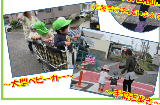
~大型ベビーカー~ ~手繋ぎ歩き~

この用水路では 運が良いとたくさんの 鯉さん達に会えることも♡ 餌やりを楽しむよ〜