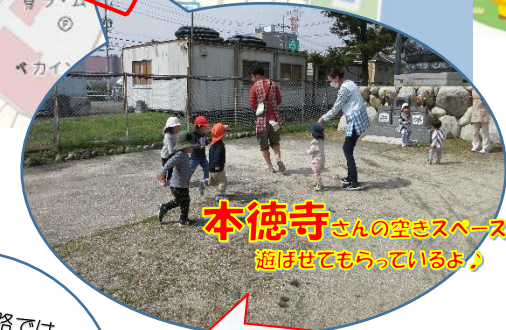
本徳寺さんの空きスペースで 遊ばせてもらっているよ♪

この用水路では 運が良いとたくさんの 鯉さん達に会えることも♡ 餌やりを楽しむよ〜