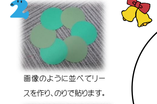
2 画像のように並べてリースを作り、のりで貼ります。