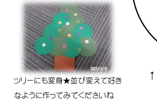
4 ツリーにも変身★並び変えて好きなように作ってみてくださいね