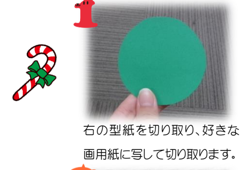
1 右の型紙を切り取り、好きな画用紙に写して切り取ります。